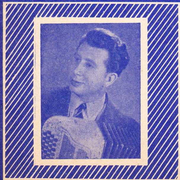
AIMABLE DISQUES "PACIFIC"