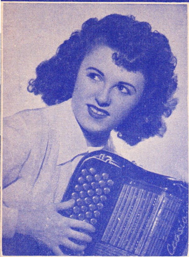
YVETTE HORNER DISQUES "PATHÉ"